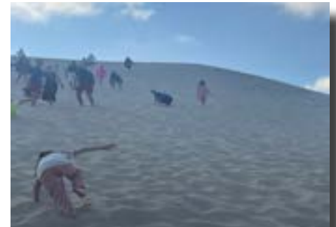
Gravir la dune du Pilat