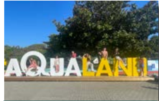
Séjour à Soulac-sur-mer