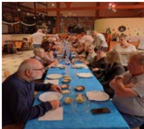
Repas de fin d'année lors du Conseil d'Administration commun