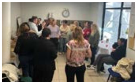
Repas de fin d'année de l'Espace Autonomie Solidarité