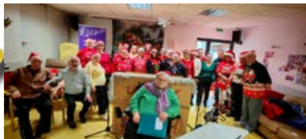
La chorale de Noël EHPAD Le château