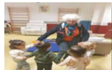
La MAM vient régulièrement rendre visite aux résidents