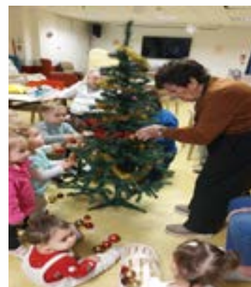
Avec la MAM à l'EHPAD Le château