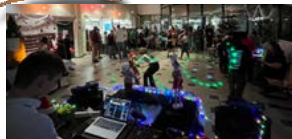
Soirée de Noël à Loumet InterGénération