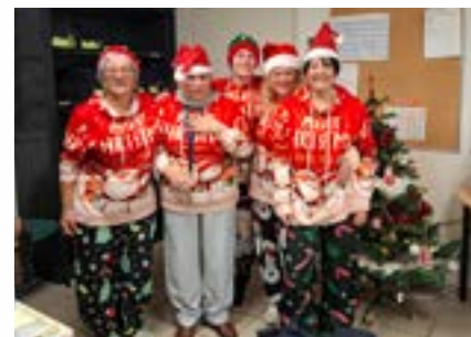
Le SSIAD lors de la tournée de Noël