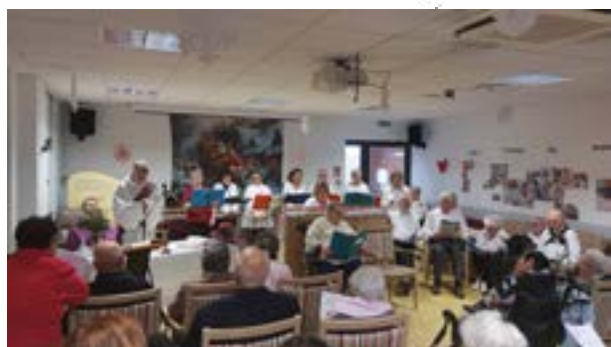
Messe de Noël à l'EHPAD Le château