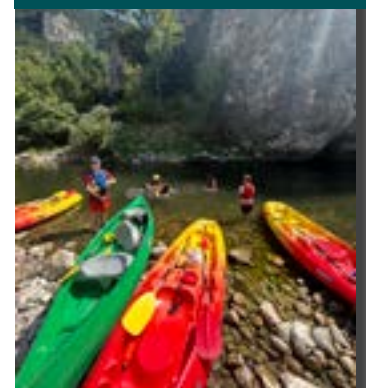
Gorges du Tarn