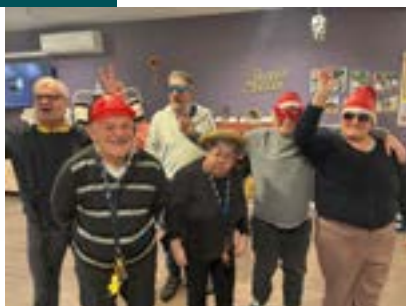
Les festivités à l'Etang d'HAPPY